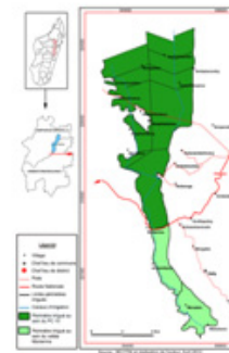
Carte n° 3 : Les Périmètres Irrigués au sein du PC 15 et de la Vallée Marianina