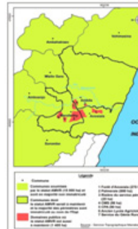
Carte n° 2 : les zones soumises par l'AMVR à Manakara