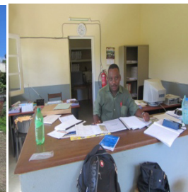
Le G.F d'Antsakoamanondro, pilote et opérationnel dans le district.