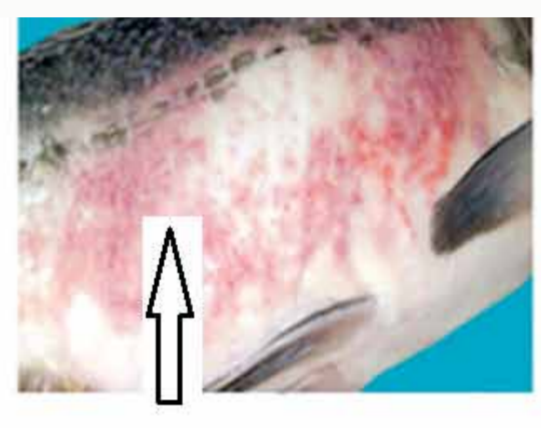
Manopy mena toa maratra ny hodiny